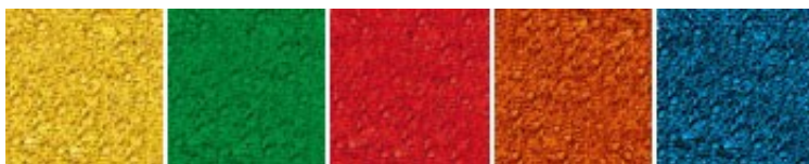
Zał. 1. Dostępna kolorystyka płytek

Oprócz wersji podstawowej, dostępne są także moduły brzegowe nawierzchni: płytki ze ściętym bokiem (o wymiarach 1000x250 mm) i płytki narożnikowe z dwoma ściętymi bokami (o wymiarach 250x250 mm).