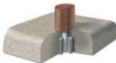
Zał. 2. Sposób mocowania urządzenia