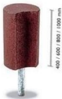
Zał. 1. Wymiary urządzenia