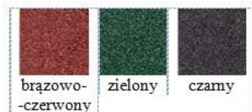
Zał. 2. Dostępna kolorystyka