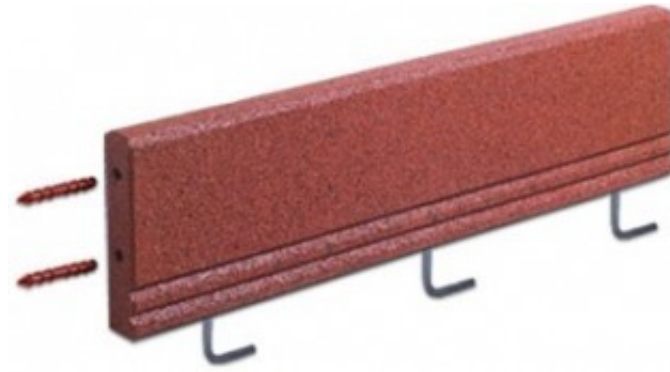
Załącznik 3. Konstrukcja obramowania