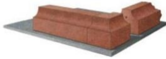
Rys. 2. Sposób mocowania