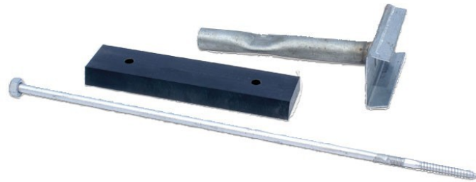
Rys. 3. Elementy mocujące