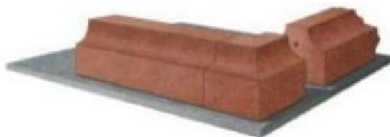
Rys. 2. Sposób mocowania