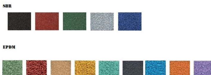
Zał.1. Dostępna kolorystyka