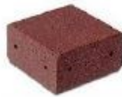
Rys. 2. Narożnik 300x300x150mm