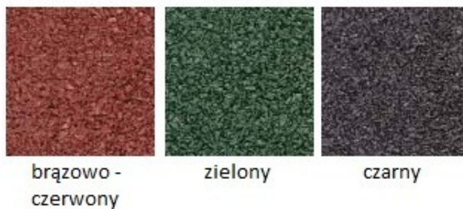
Zał. 3. Dostępna kolorystyka