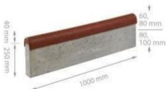
Zał. 1. Wymiary urządzenia