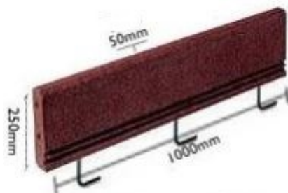
Zał. 1. Wymiary urządzenia