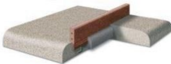
Zał. 2. Sposób mocowania urządzenia