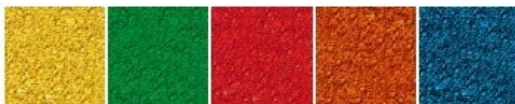
Rys. 2. Dostępna kolorystyka EPDM