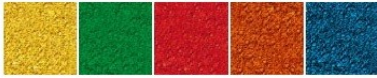
Rys. 2. Dostępna kolorystyka EPDM