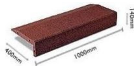
Zał. 1. Wymiary urządzenia