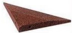
Zał. 2. Osłona