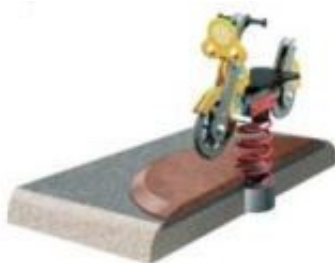
Rys. 2. Sposób mocowania urządzenia