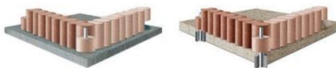
Rys. 2. Sposób mocowania urządzenia