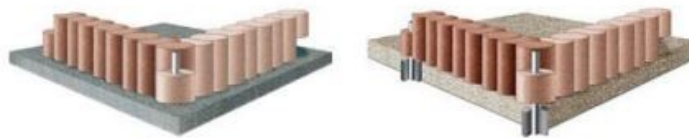
Rys. 2. Sposób mocowania urządzenia