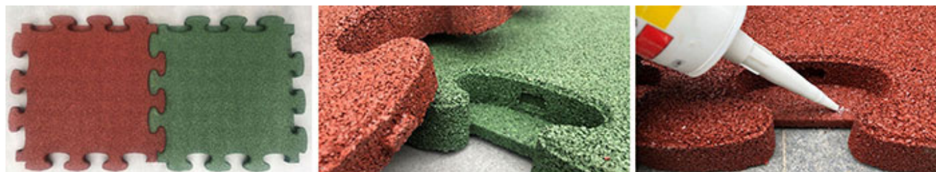
1. Tradycyjny kształt puzzla (12 wypustek)