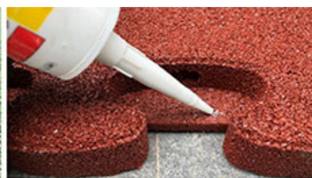
3. Dno wpustów (klejenie puzzli do siebie)