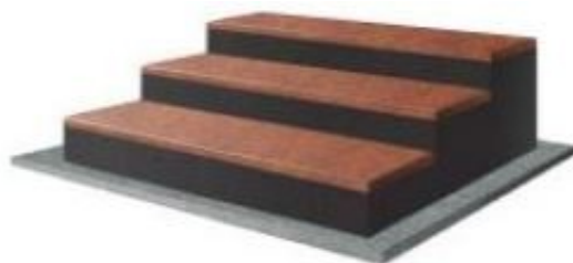
Zał. 3. Sposób mocowania