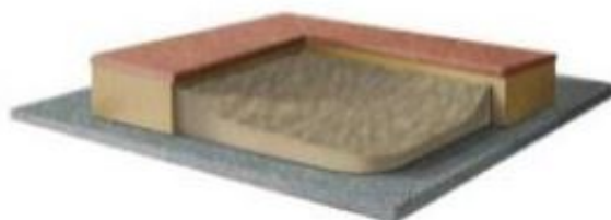
Zał. 2. Sposób mocowania